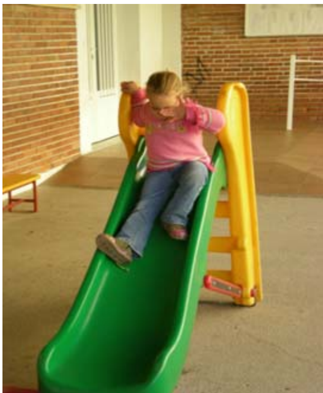
Jugamos en el patio del colegio Juan XXIII