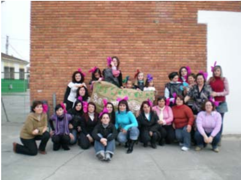
Todos en el patio cantamos el himno, y posamos junto a la bandera