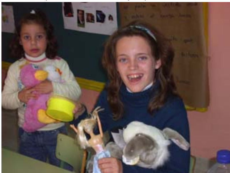
Jugamos en clase

Así pues, es a través del juego donde nos planteamos el desarrollo de la inteligencia. Este proyecto está enmarcado, entre otros, dentro del ámbito de los derechos humanos y la educación para la convivencia y la paz.