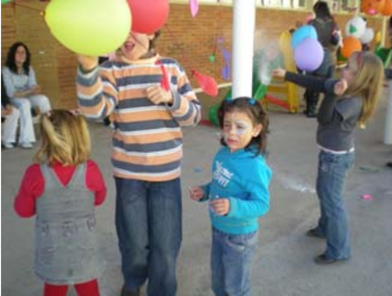
1ª Prueba: Explotar globos y encontrar una pista en su interior