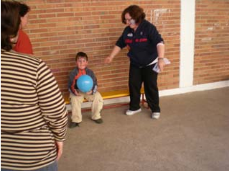
5ª Prueba: Explotamos globos con el pompis