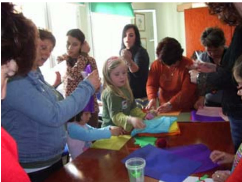
Todos juntos colaboramos en la realización de la cruz

En esta primera semana de Mayo hemos preparado y festejado el Día de la Cruz