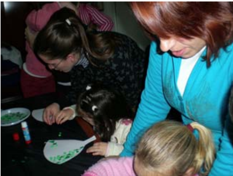
Hicimos abanicos de papel

Hoy celebramos junto a las asistentes al curso, paralelo a la guardería el “Día de Andalucía”. Ha sido un día de convivencia donde se han compartido momentos de trabajo con otros de ocio.