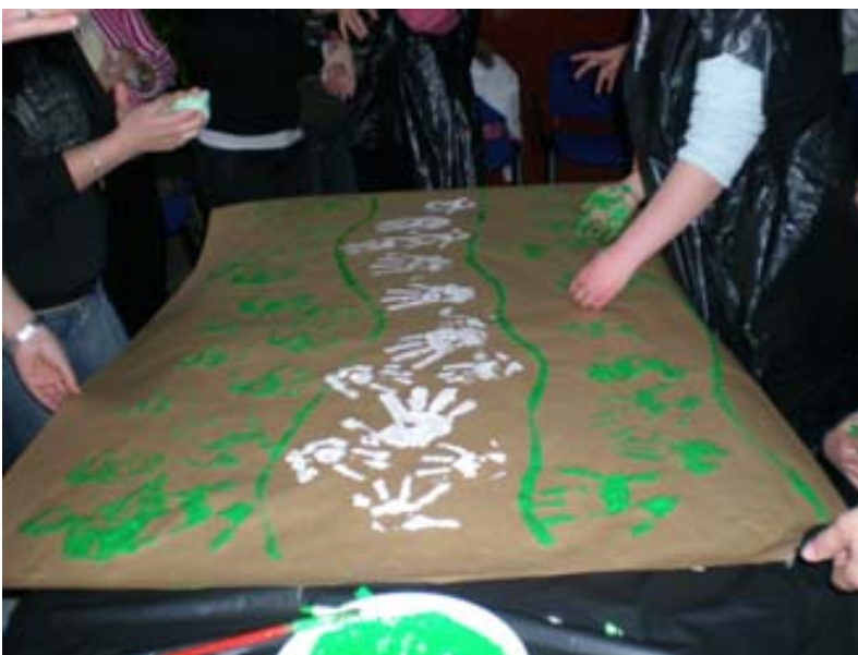
Pintamos la bandera con nuestras manos