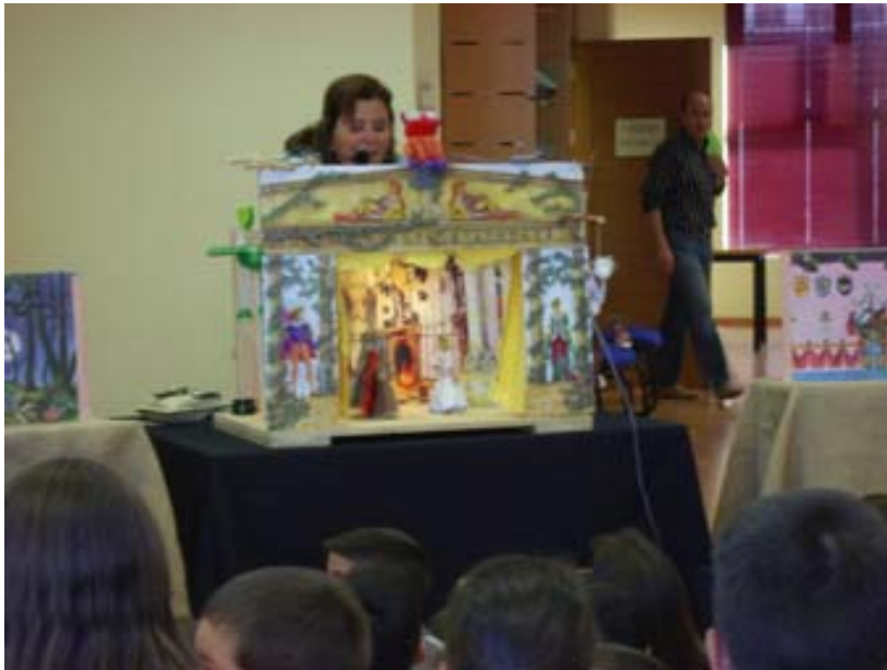
Todos preparados que empieza la función