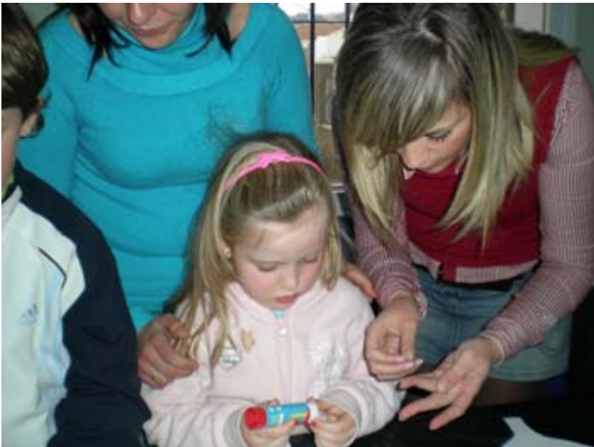
Trabajamos con las "amigas del curso"

Creo que ha sido una experiencia muy positiva para ambos grupos donde se han estrechado lazos y se ha fomentado la convivencia.