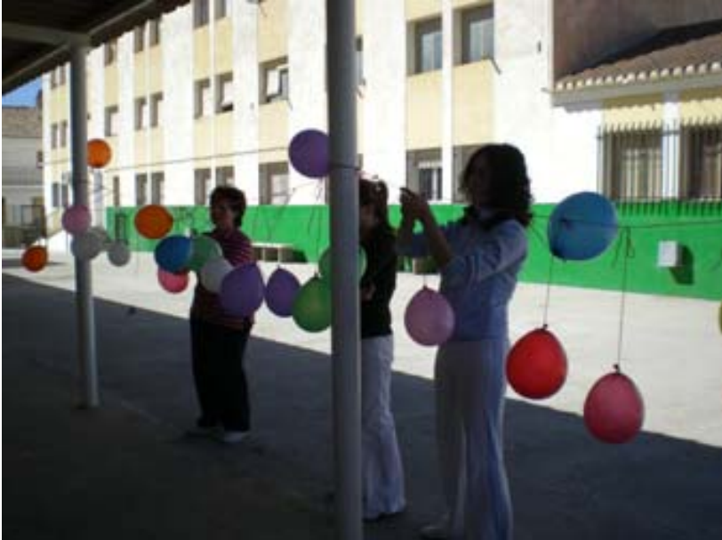
Preparamos las pruebas