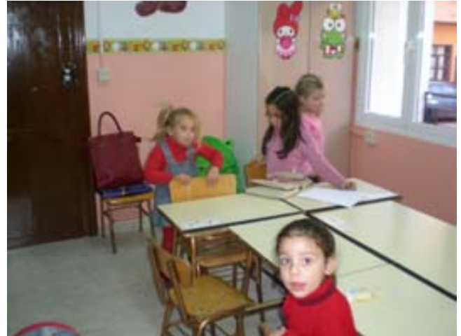
recogemos la clase

D).- Los juegos se han realizado en diferentes espacios, utilizando los recursos existentes, hemos jugado dentro y fuera de clase, hemos recurrido al juego simbólico, a los juegos tradicionales y populares de nuestro entorno, a los juegos de mesa y a juegos que nosotros mismos hemos inventado