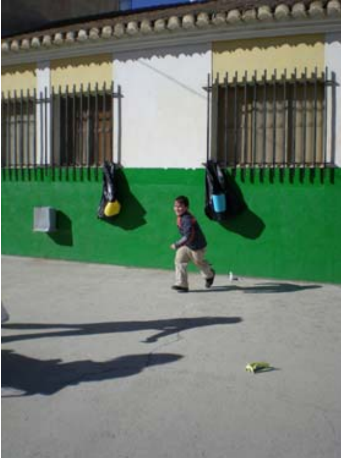
3ª Prueba: Reciclamos