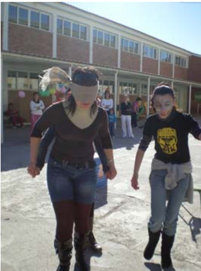
2ª Prueba: Hacer un recorrido con los ojos vendados