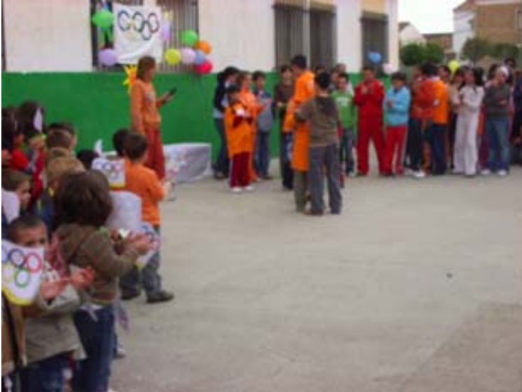
Bienvenida a los centros participantes, en el patio del Colegio

-También nos ha dado tiempo para celebrar las fiestas de cumpleaños de nuestros amigos: