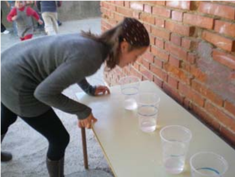
6ª Prueba: Llenar los vasos hasta la señal con agua que traemos de la fuente en la boca